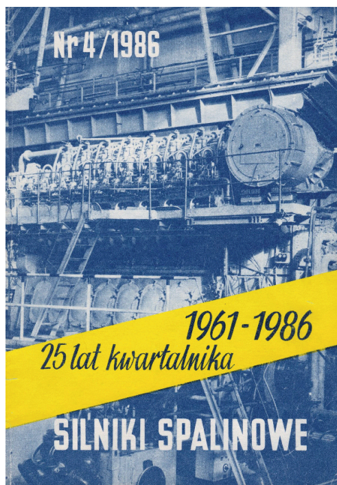
Rys. 3. Okładka numeru czasopisma Silniki Spalinowe na 25-lecie

Obowiązki redaktora naczelnego kolejno pełnili: