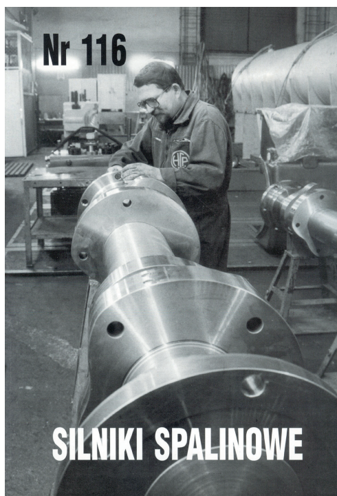
Rys. 5. Okładka ostatniego numeru czasopisma Silniki Spalinowe z 1998 roku

Kwartalnik „Silniki Spalinowe” dobrze służył przez kilka dziesięcioleci polskim silnikowcom przyczyniając się do integracji środowiska, wnosząc swój wkład w rozwój dziedziny silników spalinowych w Polsce i promując także zagranicą tę dynamicznie rozwijającą się wówczas gałąź polskiego przemysłu i polskiej nauki.