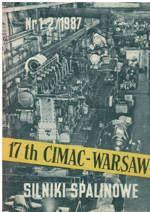
Rys. 4. Okładka Silników Spalinowych nr 1-2/1987

The magazine “Silniki Spalinowe” came into being and was edited thanks to the true enthusiasm, effort and commitment of a group of Polish combustion engine specialists. Although they were not professionals in editing technical magazines,